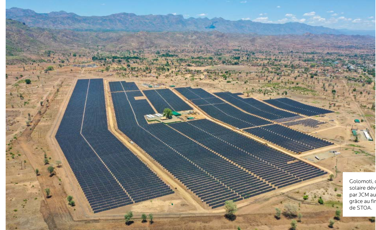
Golomoti, centrale solaire développée par JCM au Malawi grâce au financement de STOA.

Face aux bouleversements causés par le changement climatique, nous plaçons également la résilience au cœur de notre stratégie d'investissement. Nous nous assurons à ce titre que les infrastructures financées anticipent, prennent en compte et s'adaptent aux risques et changements à venir.