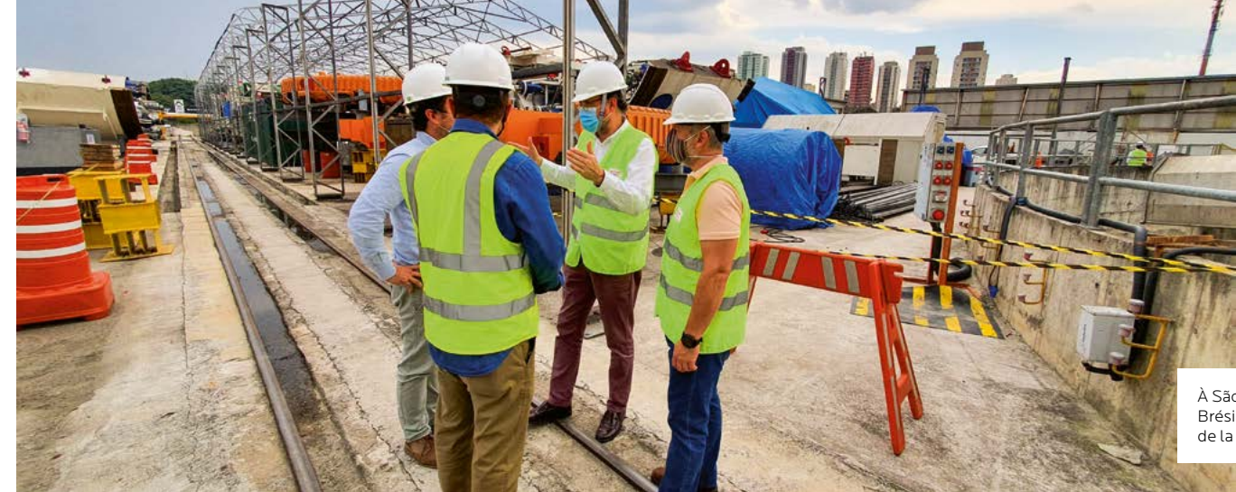
À São Paulo, au Brésil, construction de la ligne 6 du métro.

Parce que l'atteinte des ODD est une dynamique collective, STOA encourage le partage d'expériences et de bonnes pratiques avec toutes les parties prenantes (bailleurs de fonds, entreprises privées, agences de coopération internationale, organisation de la société civile) à l'occasion de conférences, de débats ou encore de campagnes de reporting. Pour renforcer en permanence la qualité de notre accompagnement, nous nous engageons également à investir chaque année dans la formation continue de nos équipes. ▣