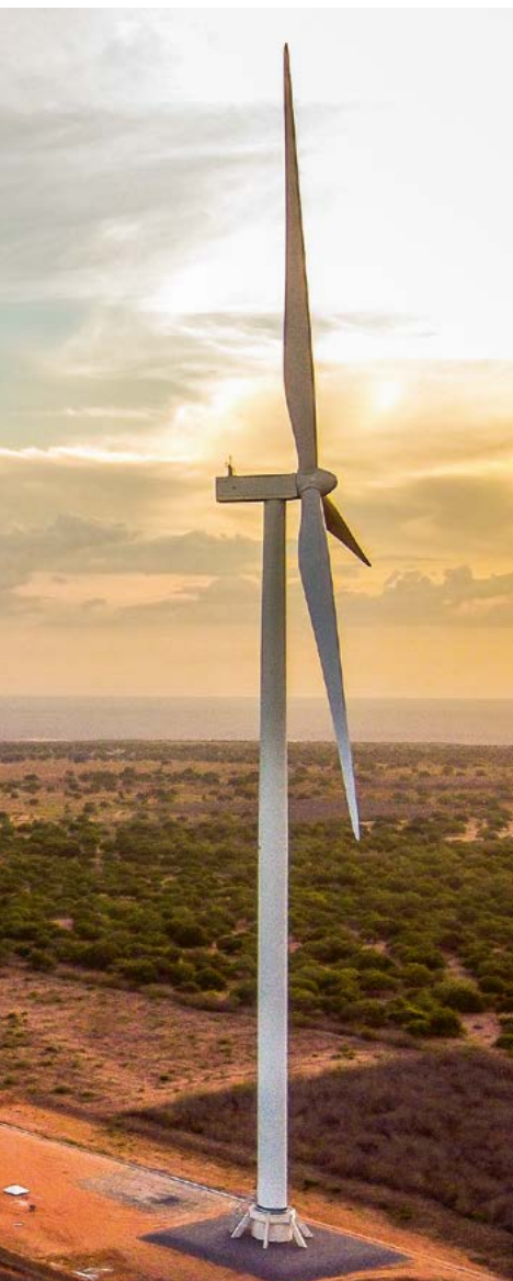
VSM 3, centrale éolienne construite par Voltaia dans l'État du Rio Grande do Norte au Brésil.

Le comité de suivi de notre raison d'être a été créé début 2022 et s'est réuni pour la première fois en septembre 2022. Ce comité a pour but d'éclairer les décisions de STOA et de son conseil d'administration vis-à-vis des engagements pris dans le cadre de sa raison d'être et d'enrichir sa réflexion dans l'élaboration de sa trajectoire à moyen et long terme. Le comité consultatif de STOA, composé de parties prenantes internes et externes, prolonge le dialogue engagé lors de l'élaboration de sa raison d'être. Il s'agit de l'élément central de la vision et du développement de STOA. Les engagements pris par STOA dans ce cadre constituent un levier de sa performance tant opérationnelle que financière. Composé de la direction générale, du responsable ESG, d'un salarié, de représentants de nos actionnaires, et des partenaires, il se réunit deux fois par an. Son rôle est d'évaluer notre activité au regard des principes et indicateurs présentés dans ce cahier de raison d'être.