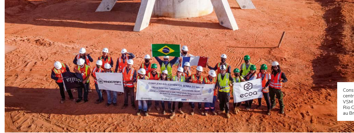
Construction de la centrale éolienne VSM 3 dans l'État du Rio Grande do Norte, au Brésil, par Voltalia.

Pour susciter un effet d'entraînement, nous nous engageons à investir là où d'autres fonds sont absents. À travers nos prises de participation, nous cherchons à donner de la visibilité à des projets d'infrastructures qui nous semblent essentiels, à renforcer leur attractivité et ainsi à mobiliser les capitaux privés d'autres acteurs. ▣